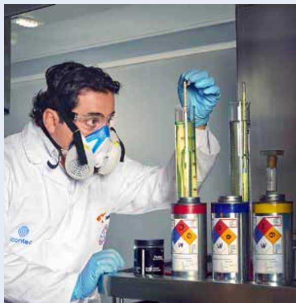
EXPERTOS QUÍMICOS realizan pruebas exhaustivas para asegurar la calidad y medida del combustible suministrado.

Como parte de su compromiso con el medio ambiente, Primax viene desarrollando combustibles diferenciados que contribuyen a reducir las emisiones del parque automotor