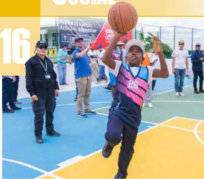
LOS NIÑOS de la Urbanización Ciudad del Valle, en el municipio de Candelaria, Valle del Cauca, cuentan con una escuela deportiva de baloncesto.