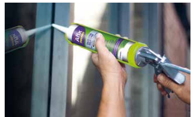
LOS ADHESIVOS y sellantes amables con el medio ambiente impactan de manera positiva las industrias de la construcción, automotriz, calzado, madera, muebles, papel y embalaje.

Gracias a su proyecto Nobleza Sostenible a los Residuos, en el que la compañía trabajó en asocio con algunos clientes de la industria de calzado, Artecola logró el objetivo de transformar 2,2 toneladas de residuos en insumos sostenibles para 800.000 pares de zapatos, proyecto con el cual ganó el Premio Assintecal Primus Inter Pares 2023 en la categoría de Sostenibilidad.