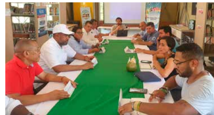
EL PRIMER Encuentro de Mujeres Piangüeras del Pacífico Colombiano se llevó a cabo en Nuquí, a comienzos de agosto de este año.

La extracción de la piangua, un molusco del Pacífico, es una actividad económica que sustenta a aproximadamente 30 mil familias y garantiza la conservación de los ecosistemas