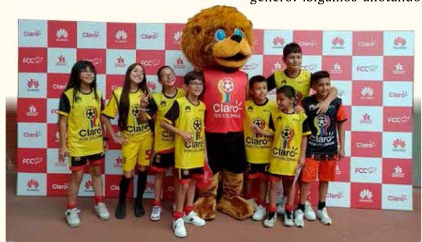
ESTE AÑO participarán más de 2.800 niños, niñas y adolescentes de comunidades vulnerables de 10 departamentos.

LA COPA fomenta la paz, la equidad de género y el trabajo en equipo.