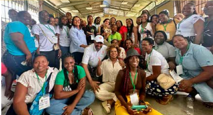
LA MINISTRA de Ambiente, Susana Muhamad, se reunió con mujeres piangüeras, quienes desempeñan un papel fundamental en la conservación de los ecosistemas costeros.

El Pacífico cuenta con 267.835 hectáreas de manglares, aproximadamente. Estos ecosistemas son fundamentales para mantener el equilibrio ecológico y la biodiversi-