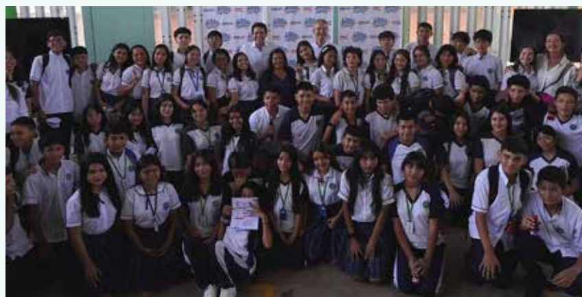
EL AÑO pasado más del 50 % del presupuesto de inversión social de BBVA en Colombia se destinó a iniciativas relacionadas con el apoyo a la permanencia escolar.

LAS 3.000 tabletas que entregarán las entidades en 200 colegios facilitarán el acceso a libros literarios y formativos.