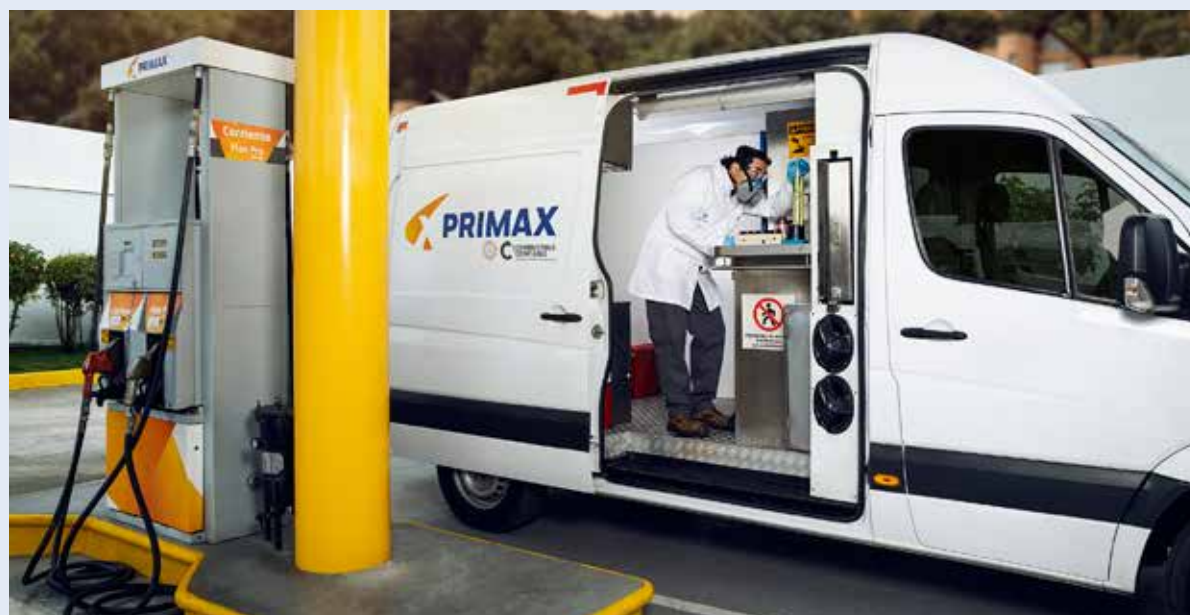
LA COMPAÑÍA cuenta con productos como el Max Pro-Diésel, un combustible que reduce las emisiones contaminantes en un 25 %.