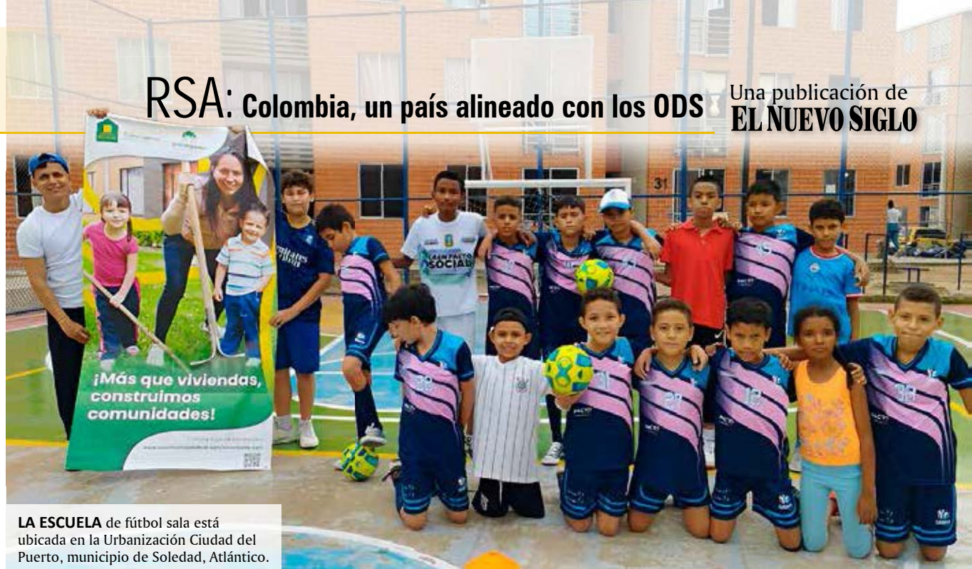
LA ESCUELA de fútbol sala está ubicada en la Urbanización Ciudad del Puerto, municipio de Soledad, Atlántico.