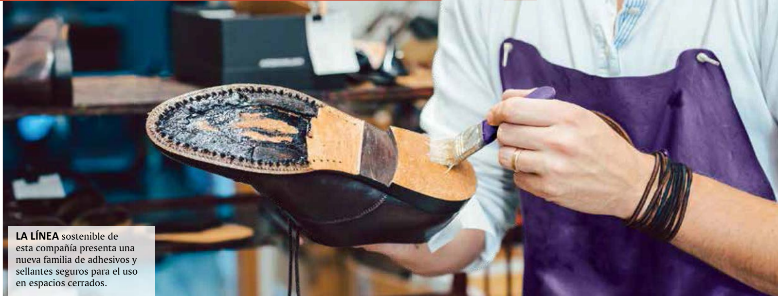
LA LÍNEA sostenible de esta compañía presenta una nueva familia de adhesivos y sellantes seguros para el uso en espacios cerrados.

Desde su origen, esta empresa ha estado alineada con lo que hoy se denomina ESG (Environmental, Social, and Governance). Su historia demuestra esta filosofía. En sus 75 años Artecola invierte cada vez más en este concepto. “Desde 2014, la sostenibilidad –que ya se practicaba desde hace décadas– comenzó a estar presente en la estrategia formal de la empresa. Creemos en el equilibrio entre los pilares medioambiental, social y económico de una ges-